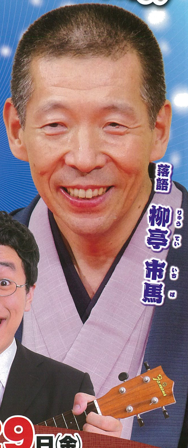
落語 柳亭 市馬 やなぎや しゅうま