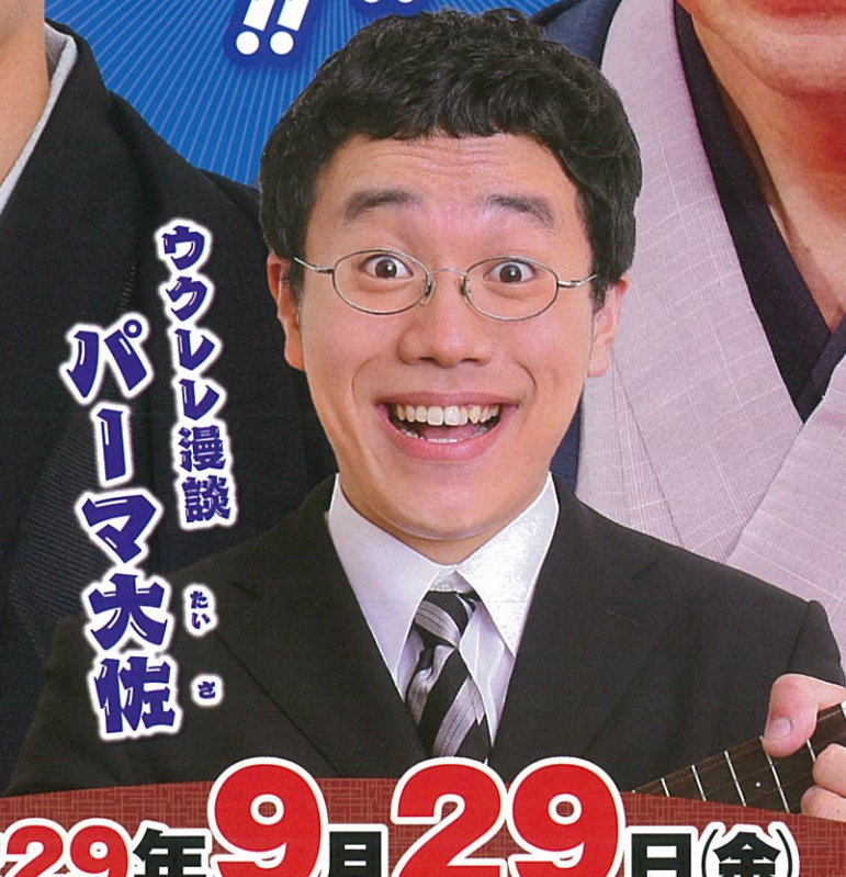
ウクレレ漫談 パイマ大佐 たい せい